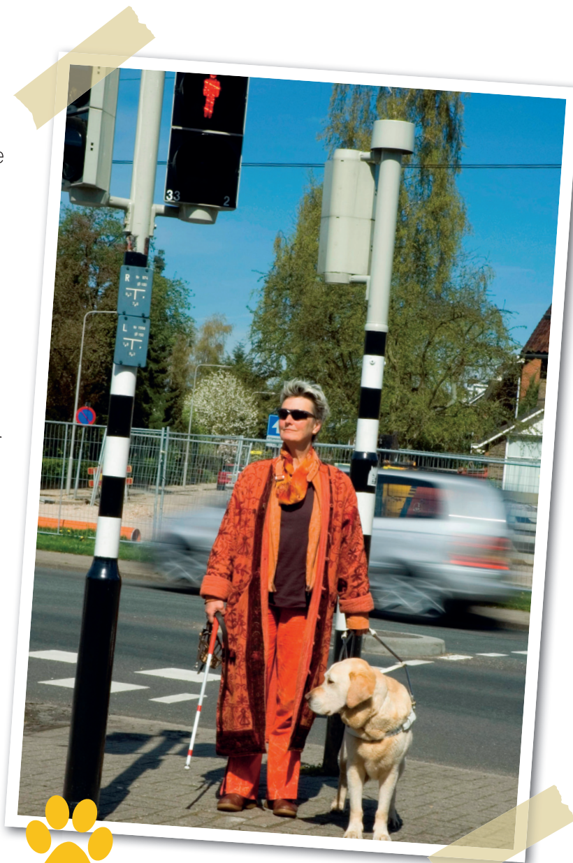
Deze geleidehond leidt zijn baas door het drukke verkeer.

In deze folder lees je wat je beter wel en niet kunt doen als je een geleidehond en zijn blinde baas tegenkomt.